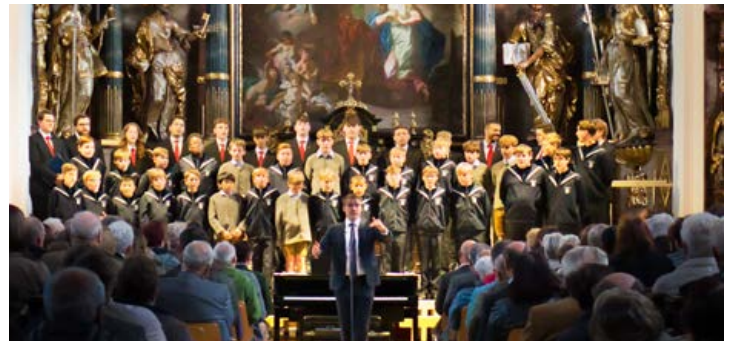
Florianer Sängerknaben in der Pfarrkirche Schiedlberg