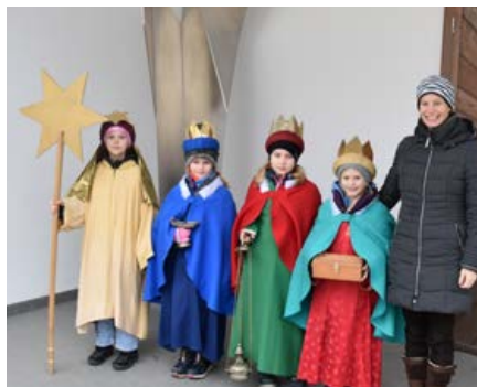
Seite 7: Sternsinger-Aktion