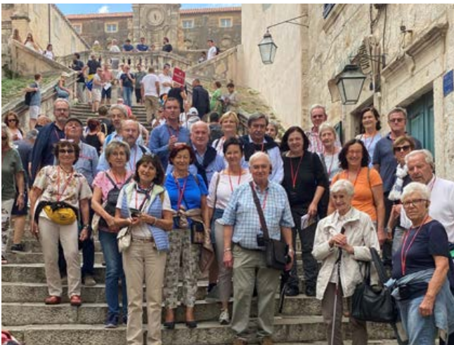
Pfarrreise – Dubrovnik