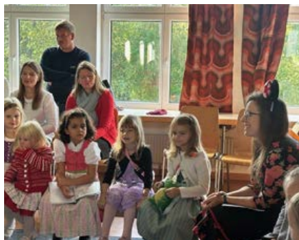
Seite 5: Kinderkirche

Und das Licht leuchtet in der Finsternis Joh 1, 5